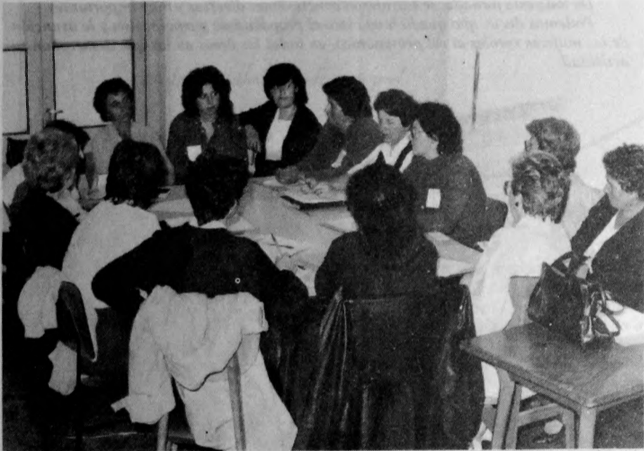
Comisión de "Condiciones de vida" debatiendo